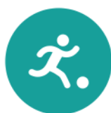
Spel en beweging/ bewegingsonderwijs